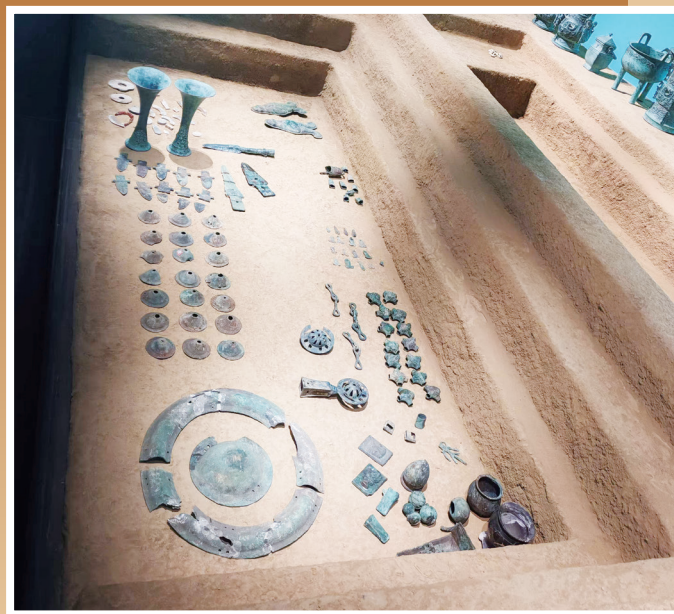
种类繁多的车马饰