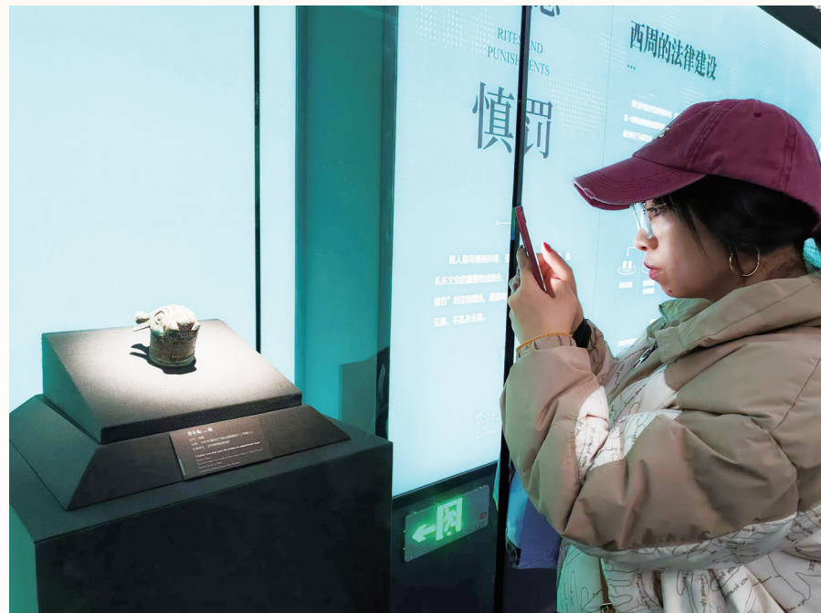
游客被精致的车马饰所吸引

为了让游客更直观地了解西周车马器的使用场景和车饰的精美程度,宝鸡青铜器博物院经过提升改造,专门设置了车马器动态演示