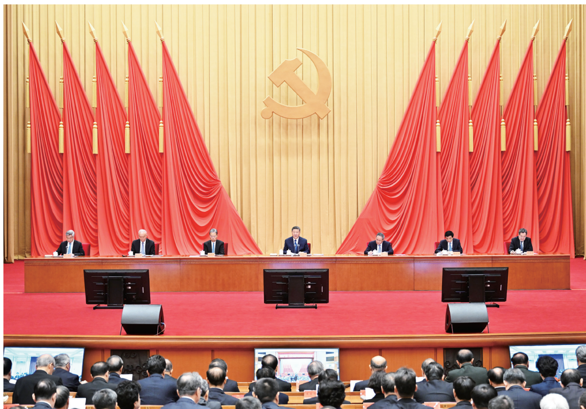
1月6日，中共中央总书记、国家主席、中央军委主席习近平在中国共产党第二十届中央纪律检查委员会第四次全体会议上发表重要讲话。李强、赵乐际、王沪宁、蔡奇、丁薛祥、李希出席会议。