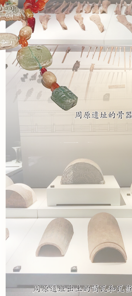
周原遗址出土的陶瓦和瓦当