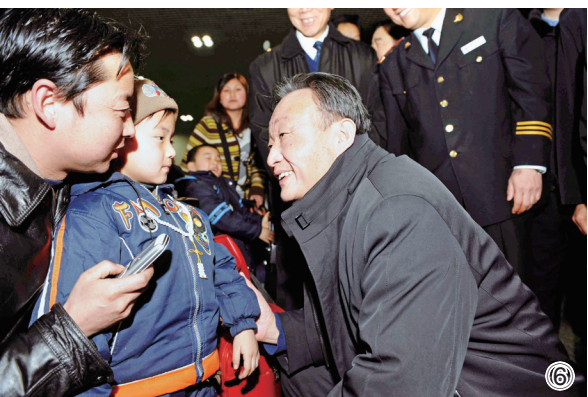
图⑥：2008年2月3日，吴邦国同志在北京西站候车室与旅客交谈。