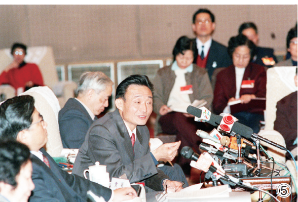
图⑤：1994年3月，时任上海市委书记的吴邦国同志在全国两会上海代表团全团会议上。