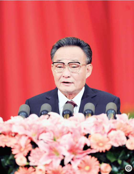
图⑧：2011年3月10日，十一届全国人大四次会议在北京人民大会堂举行第二次全体会议。吴邦国同志作全国人民代表大会常务委