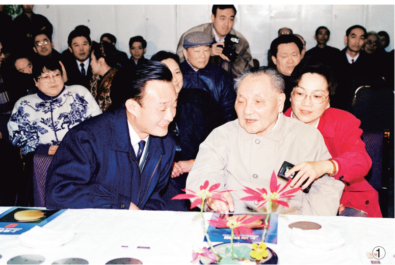
图①：1992年2月10日，邓小平同志在上海贝岭微电子制造有限公司参观时与吴邦国同志交谈。