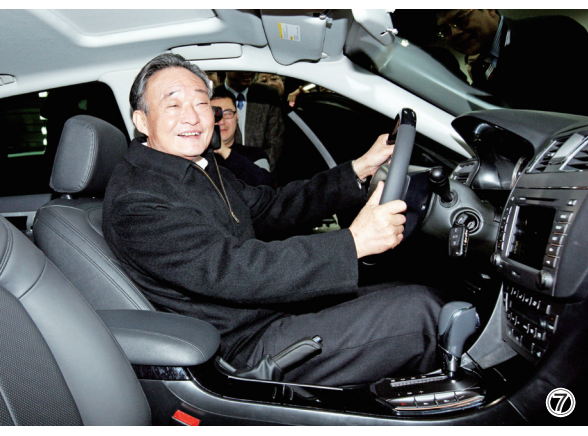
图⑦：2010年1月30日，吴邦国同志在上海汽车集团股份有限公司技术中心察看新能源样车。