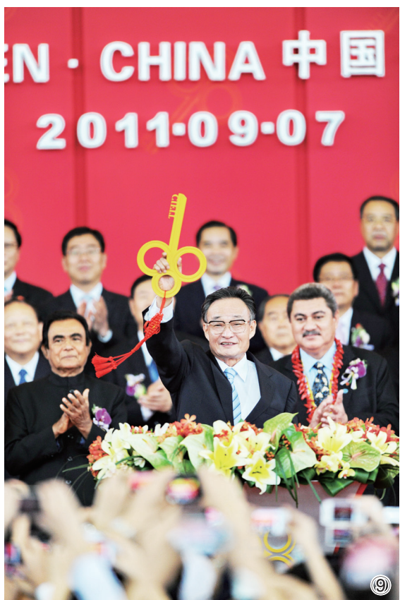
图⑨：2011年9月7日，吴邦国同志在福建厦门出席第十五届中国国际投资贸易洽谈会开馆式。