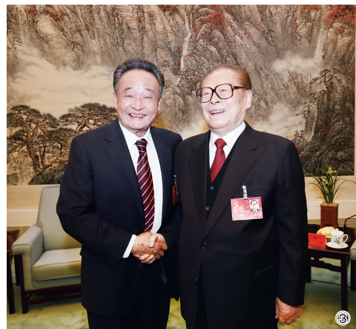
图③：2012年11月14日，中国共产党第十八次全国代表大会在北京闭幕。这是闭幕会前，江泽民同志与吴邦国同志在一起。