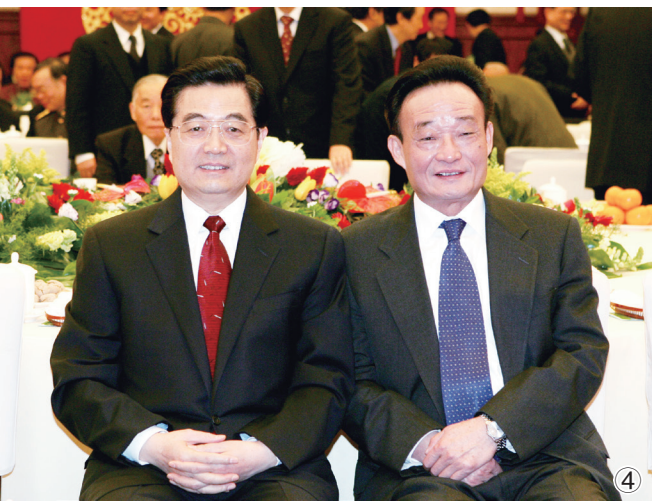
图④：二〇〇五年一月一日，全国政协在北京举行新年茶话会。这是胡锦涛同志与吴邦国同志在一起。新华社记者 樊如钧摄