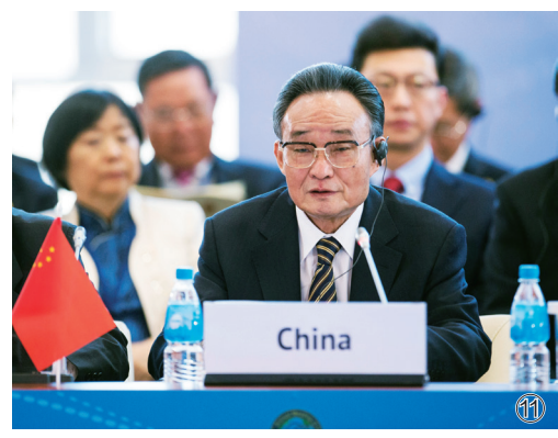
图⑪：2013年1月28日，吴邦国同志在俄罗斯符拉迪沃斯托克出席亚太会议论坛第21届年会，并作题为《坚持和平发展 促进合作共赢》的主旨发言。