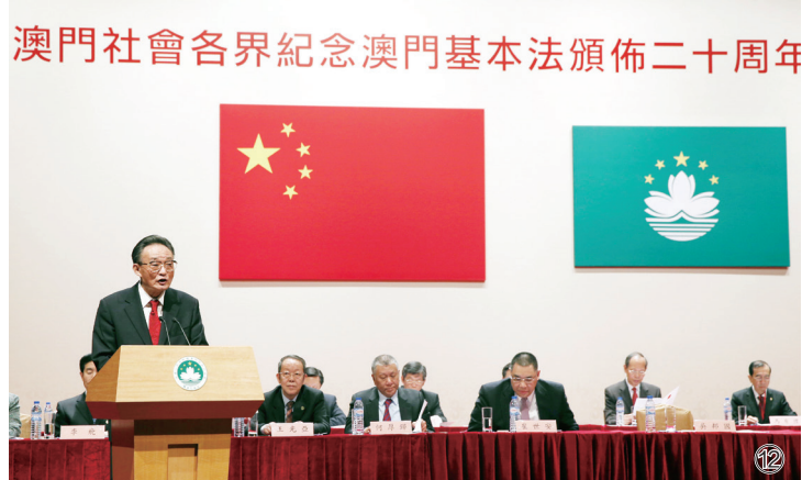
图⑫：2013年2月21日，吴邦国同志在澳门文化中心出席澳门社会各界纪念澳门基本法颁布20周年启动大会并发表讲话。