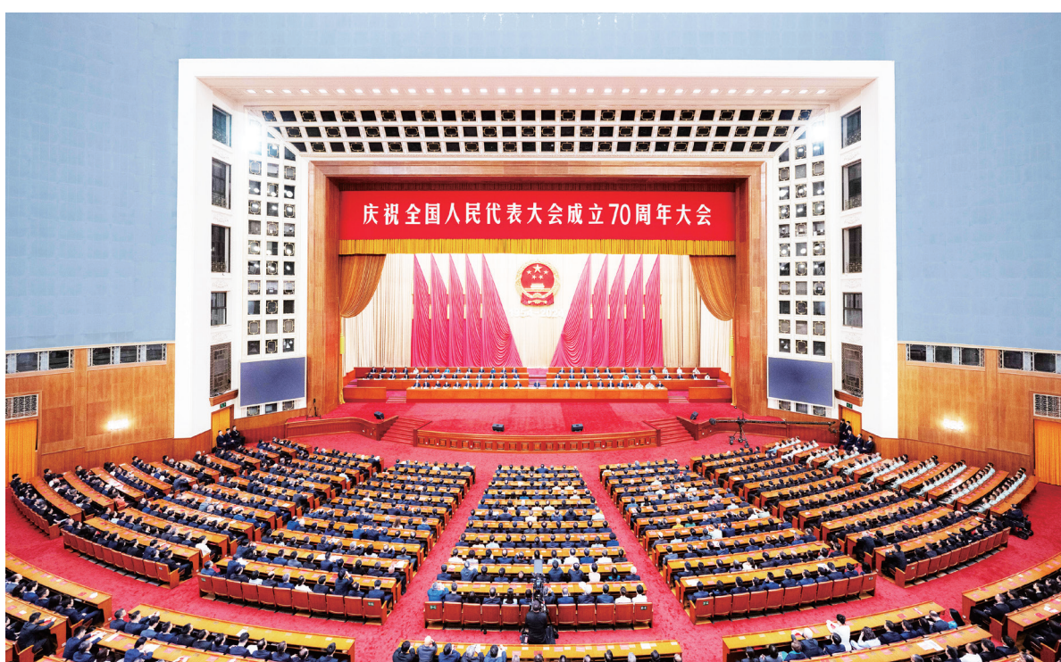
9月14日上午，中共中央、全国人大常委会在北京人民大会堂隆重举行庆祝全国人民代表大会成立70周年大会。

新华社北京9月14日电 中共中央、全国人大常委会14日上午在人民大会堂隆重举行庆祝全国人民代表大会成立70周年大会。中共中央总书记、国家主席、中央军委主席习近平出席会议并发表重要讲话。他强调，要进一步坚定道路自信、理论自信、制度自信、文化自信，发展全过程人民民主，坚持好、完善好、运行好人民代表大会制度，为实现新时代新征程党和人民的奋斗目标提供坚实制度保障。