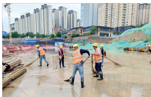
项目工地人员清理积水