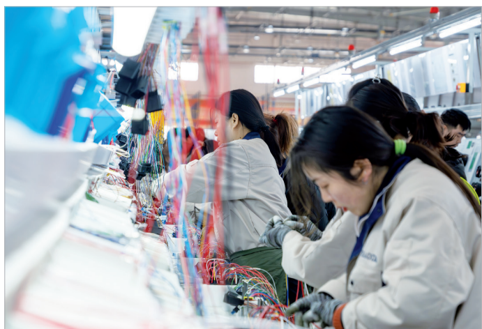
豪达豪润汽车配件有限公司日产700套吉利汽车专用线束