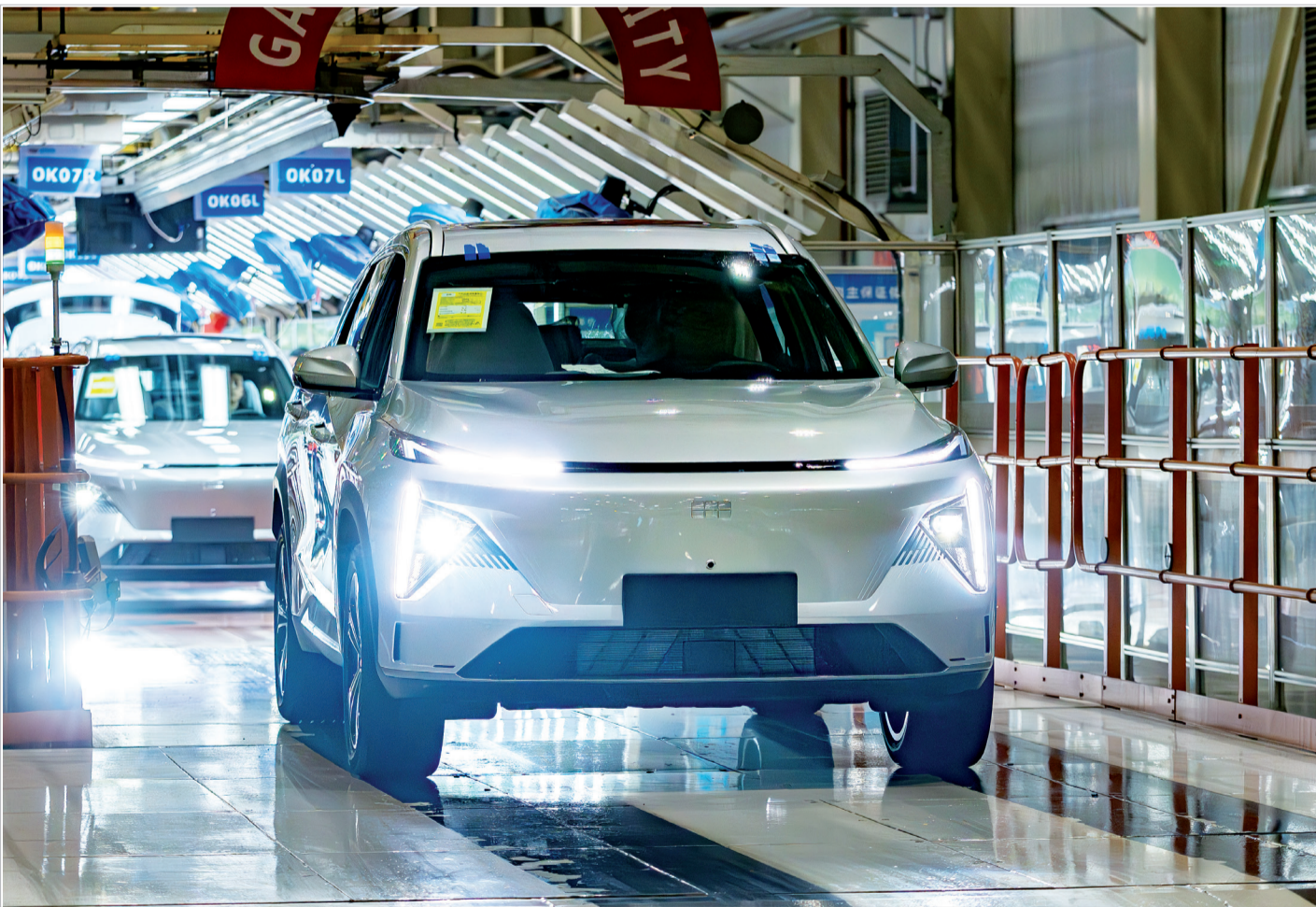
3月21日深夜，又一辆吉利银河L7下线。

如今，在吉利、陕汽等整车企业的带动下，已有300多户汽车及零部件企业落户宝鸡，其中汽车发动机、线束、座椅、汽车玻璃、轮胎等重要零部件的本地化，不仅大大降低了整车企业的运行成本，更让我市的汽车产业发展愈发强劲，汽车产业链更加完善。