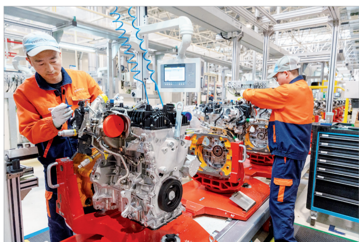
工人对发动机进行检测