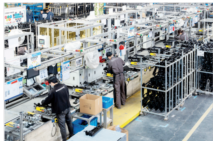
汽车座椅滑轨装配生产线