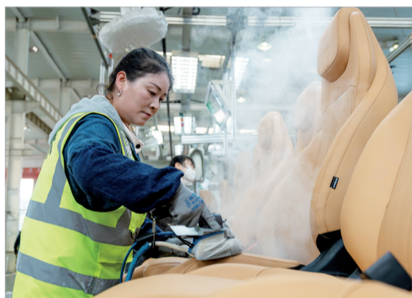
工人对吉利银河L7座椅进行整形