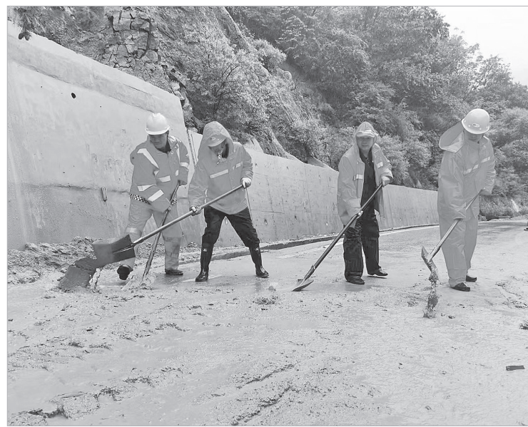
市公路局开展公路防汛工作

暴雨来临时,他们冲锋在一线,清淤、排水、守护道路,为群众生命财产安全、车辆通行顺畅提供有力保障;烈日炎炎时,他们未雨绸缪,加强预案,做好演练、备足物资,坚持“汛期不过、检查不停、整改不止”。