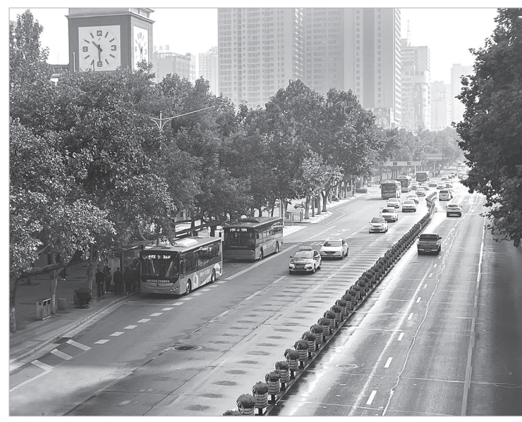
(本版稿件除署名外由本报记者黎楠采访)

我市已形成结构合理、优质多元、经济舒适、绿色低碳、安全高效的公共交通发展新格局,绿色出行深入人心。