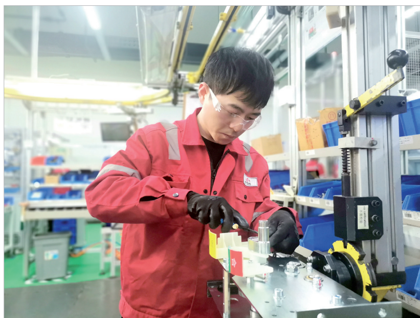
工人在装配中压真空断路器零部件

本报讯 2月8日,位于宝鸡高新区的施耐德(陕西)宝光电器有限公司一片繁忙,工人正在加