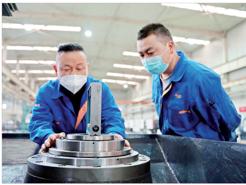
宝鸡机床重点项目装配工作进入最后阶段