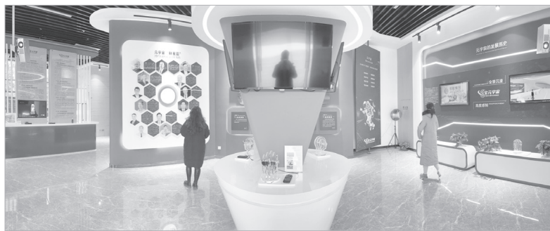
宝鸡市民“打卡”宝元宇宙展示体验馆

制加快推进数据有序共享工作方案》、《宝鸡市政务数据共享管理办法》；建立全市政务信息资源共享机制，推动“一件事一次办”顺利开展；扎实推进宝鸡市动态人口分析系统、宝鸡市证照电子化、宝鸡市企业数据库及服务系统、宝鸡市政务云平台升级扩容等信息化项目建设，数据治理方面的探索和实践位居全省前列。