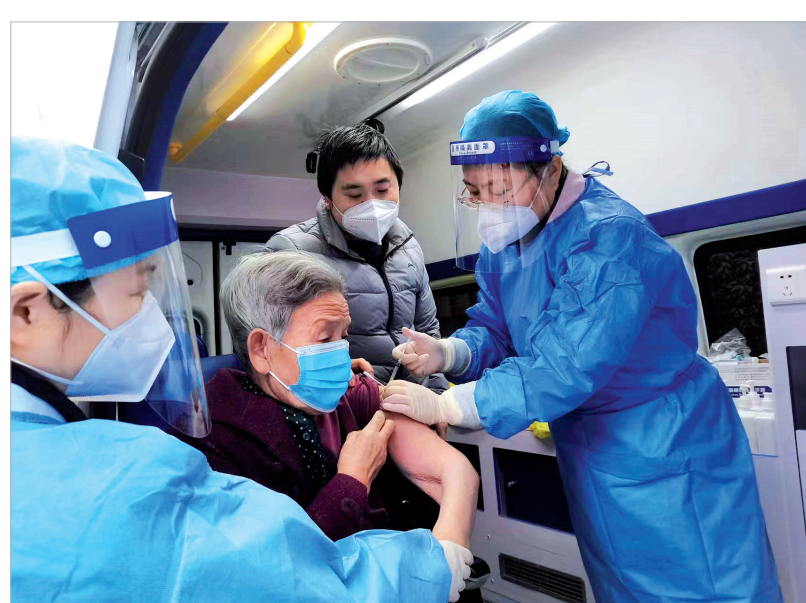
社区卫生服务中心医护人员为老人接种疫苗

“过节期间,总有居民会突发一些紧急情况需要就医。比如说,饮食不当出现肠胃问题的,或是磕