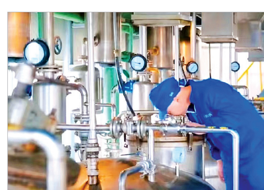
提取车间工人紧张地忙碌着

本报讯 4个车间开足马力忙生产,百余名员工在生产一线过大年。日前,记者从陕西华西制药股份有限公司了解到,春节期间,公司共生产成品药55万盒,产值达1200万元。