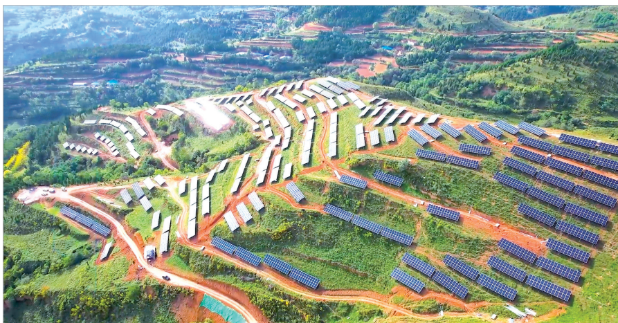
大唐陈仓贾村100兆瓦光伏发电项目