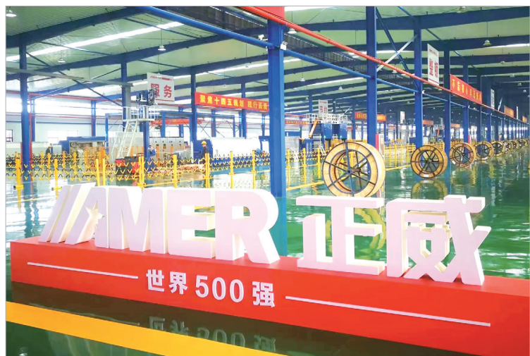
正威宝鸡铜基新材料产业园