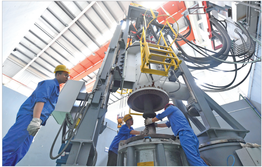
宝鸡鑫诺新金属材料有限公司医用钛材生产线

平台建设是科技创新的有效载体,对于汇聚创新资源、凝聚创新力量、集聚创新优势具有重要作用。近年来,宝鸡高新区立足全区主导产业振兴和战略性新兴产业发展需要,重点支持企业与高等院校和科研单位采取多种合作形式共建工程技术研究中心、企业技术中心、博士后工作站、院士工作站等各类研发机构。出台《宝鸡高新区高校院所创新平台管理办法》,先后与中科院、西安交通大学、华中科技大学、南京理工大学、西北工业大学等高校、科研院所强强联合,引智库、