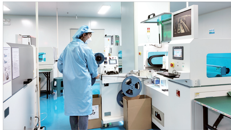
宝鸡百世博瑞电子科技有限公司生产车间一角

宝鸡普沃电子科技有限公司的落户,正是宝鸡高新区积极用好综合保税区这一对外开放新高地,推动区域外贸经济转型升级的生动缩影。今年以来,宝鸡高新区将招引新兴产业“落地成链”和提升外资利用质量紧密结合,聚焦集成电路制造、信息技术应用与创新等新兴产业方向,紧盯外资企业加快从东部沿海向中西部