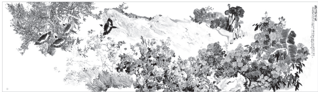
美术作品《盛世锦绣图》