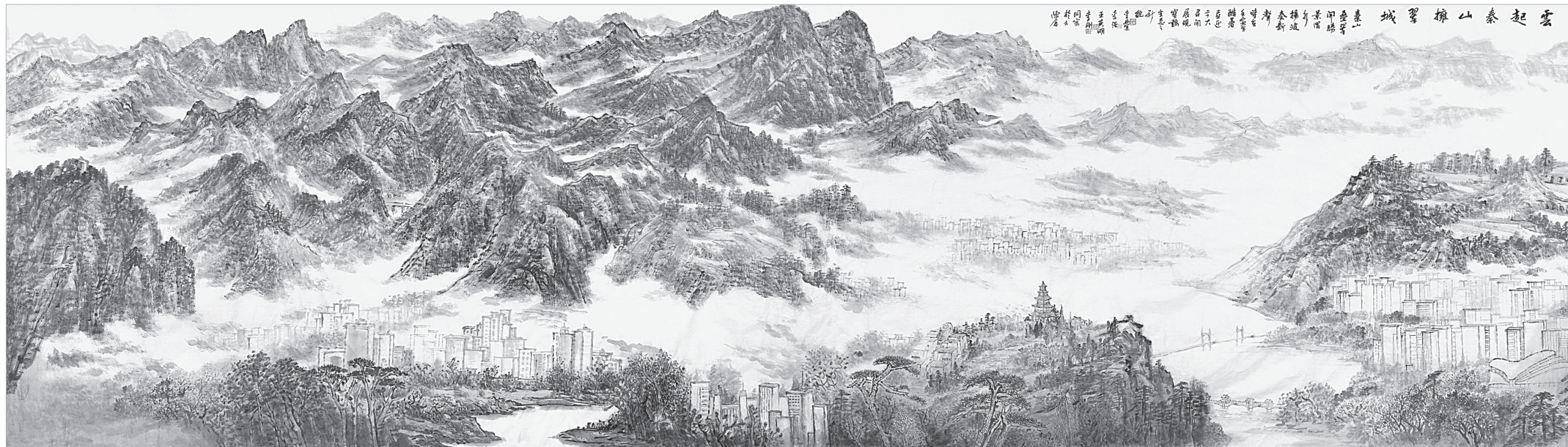
美术作品《云起秦山拥翠城》