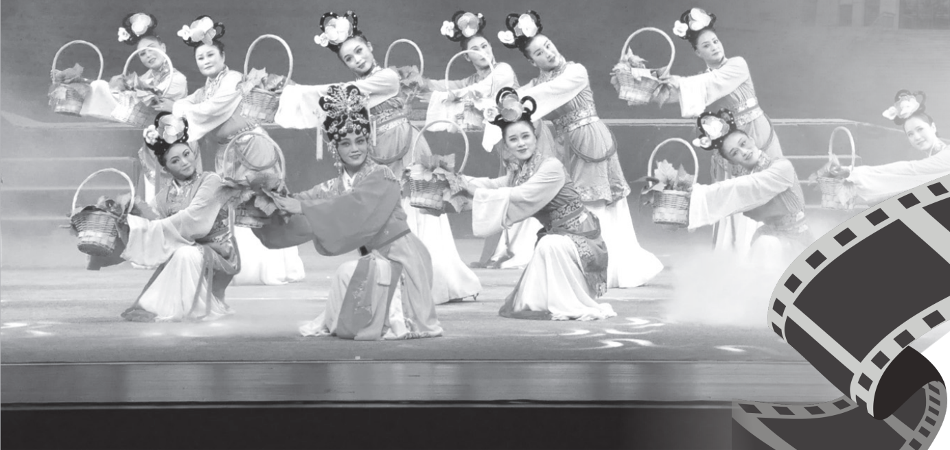
现代化的岐山大剧院里正在上演戏剧

岐山剧院最早在岐山县城东大街，它的原址为山西会馆。会馆面北坐南，临街而建。街面中间是山门，两侧是街房，山门与西面街房中间门首悬有“山西会馆”牌匾一方。再向里，便是宽敞坦荡的平台，院庭宏大，两边榆槐参天，荫如伞盖，是平时集会、看戏的地方。平台南端有三间戏楼，台口正对山门大殿。戏楼分上下两层。戏楼前檐上制有一块“同乐台”牌匾。整个会馆占地十八亩，设施齐全，建筑布局严谨，气势壮观。