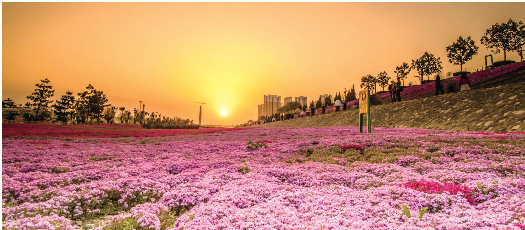
陈仓印象七彩花海