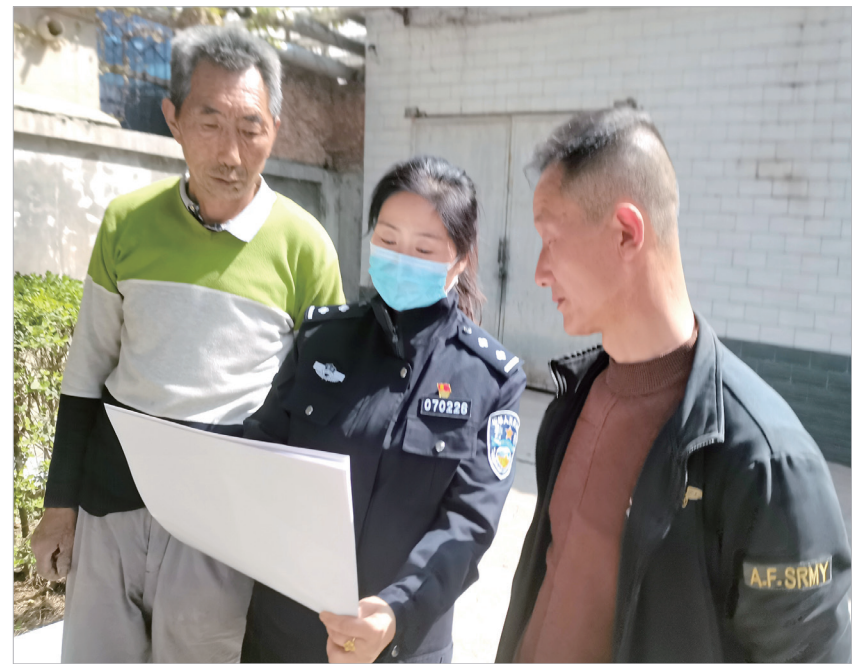
民警向群众宣传森林防火知识

本报讯 护林木,不吸烟,文明就在你身边;群策群防,森林防火有力量……连日来,凤翔公安局森林派出所的大喇叭宣传车每天在城区大街小巷穿梭,为群众宣传森林防火知识。为严防森林火灾,该派出所紧盯重点区域、重点时段和重点人群,巡查火灾隐患,筑牢森林“防火墙”。