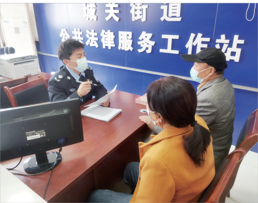
扶风县司法局城关司法所开展法律咨询服务

点和落脚点,发挥普法宣传、人民调解、社区矫正等职能,高效推动基层治理体系和治理能力现代化建设,筑牢了司法为民“连心桥”,打通了法律服务群众“最后一公里”。