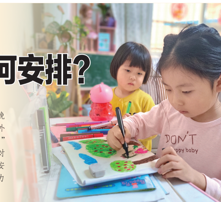
网课之余,学生在家中画画。

“孩子好像一下子进入了放假模式,对学习缺乏兴趣,晚上兴奋得不睡觉。应该怎么调整孩子的状态?”“因为不能外出,孩子在家就喜欢看电视,我要如何安排他的居家生活?”按照疫情防控需要,市区中小学、幼儿园暂停到校上课。面对居家学习的孩子,不少家长遇到了同样的困惑,如何科学安排孩子一天的学习生活,让天性好动的孩子,尤其是自制力较差的低龄孩子,拥有更加丰富充实的居家学习生活呢?