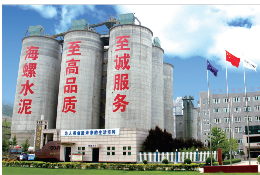
宝鸡市众喜金陵河水泥有限公司

业，为高质量工业产业化项目列出“时间表”、下达“任务书”、画出“路线图”、吹响“催征鼓”，奋力打造先进材料、高端装备制造、轨道交通、食品医药、智能制造5个百亿级产业集群。