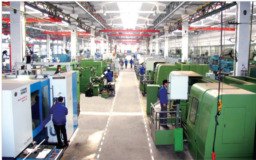
陕西北方动力有限责任公司发动机曲轴生产车间

思路决定出路，目标引领方向。为了让这些重点项目落地生根，推动工业强市“1459”工程在陈仓“开花结果”，陈仓区以工业发展大会为契机，出台《实施意见》，旨在凝心聚力抓项目、心无旁骛干工