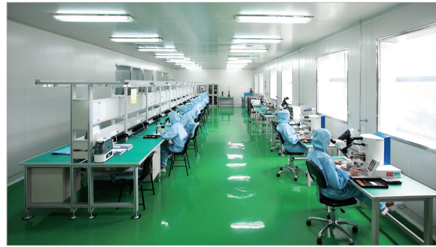
陕西群力电工有限责任公司密封生产线