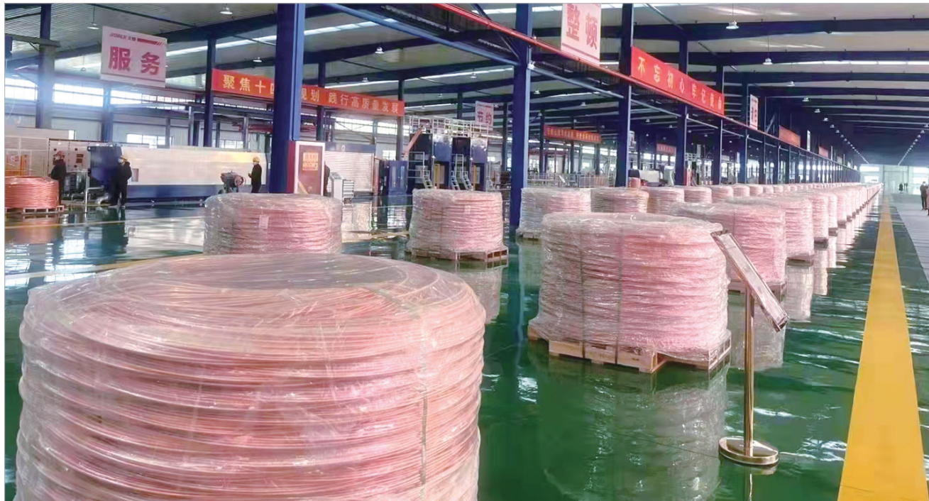
正威10万吨精密铜线项目建成投产