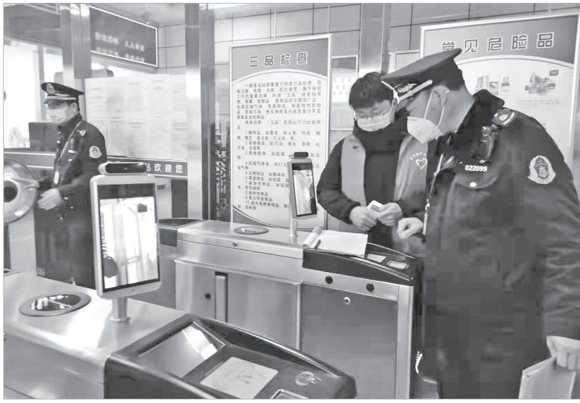
执法人员在汽车站进行日常执法检查

快推广95128老年人约车热线,持续推进班线客运和通村客运公交化改造,全面提升客运站场换乘和综合运输服务水平,更好满足群众出行需求。