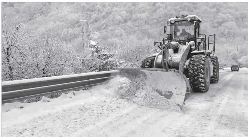
交通运输部门除雪保畅通

此外,持续加快“公交都市”创建,不断完善公交优先发展政策保障体系,建设高新大道、公园路等路段公交专用道、港湾式停靠站,公交优先通行交叉口等设施。推进城市绿色货运配送示范工程创建工作,加快物流园区、城市公共配送中心和末端公共配送站等城市配送基础设施建设,发展新能源配送车辆。加