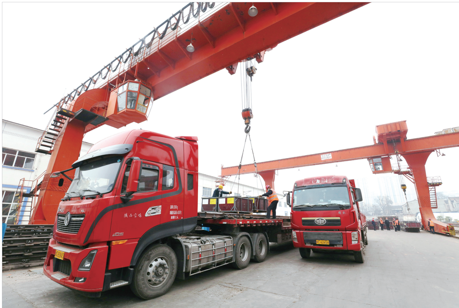
宝桥物流中心在发运成品道岔