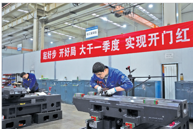
宝鸡机床集团整机装配车间紧张有序的劳动场景