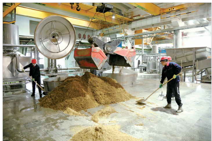
陕西西凤酒股份有限公司 907 制酒车间生产场景