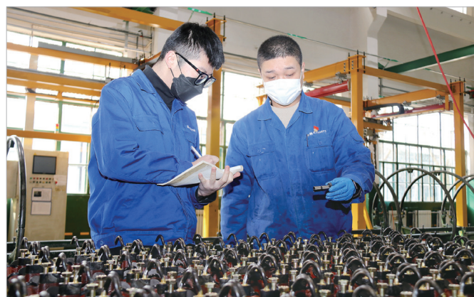
陕西北方动力有限责任公司工人在检验产品