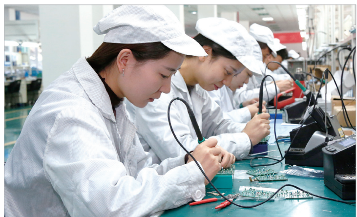
宝鸡烽火集团总装车间工人们在组装产品