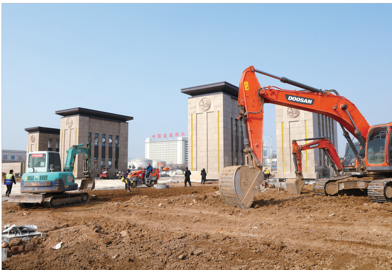
陕西西凤酒股份有限公司南门工地项目建设现场

奋进开新局，起跑就冲刺。宝鸡广大干群踔厉奋发、笃行不怠，忙生产、搞建设、抓质量、促发展，齐心协力为城市带来一片高质量发展的喜人春光。