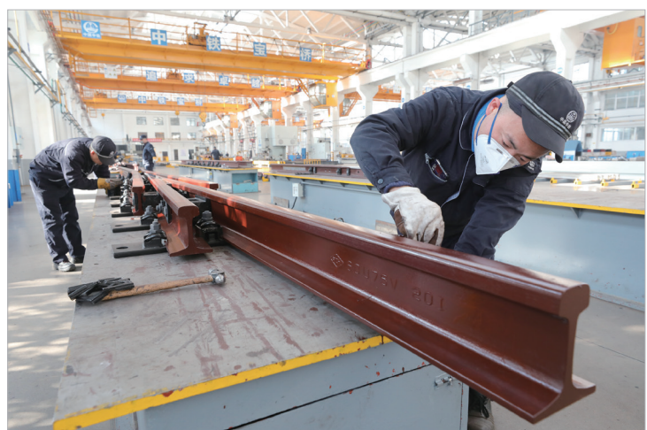
中铁宝桥集团道岔分公司工人们在组装合金钢辙叉