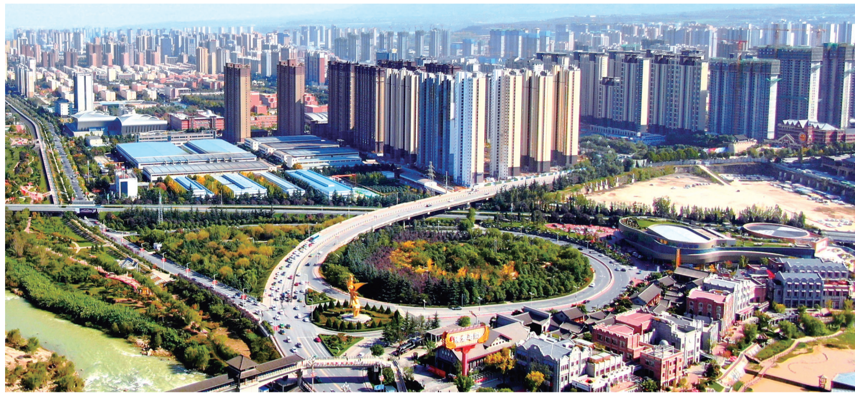
日新月异的宝鸡高新区

万物萌发的春天,宝鸡高新区尽显勃勃生机。高楼林立、企业云集、商业繁荣、人才聚集,这里是全市改革开放的“火车头”、科技创新的主引擎、招商引资的主力军和高质量发展的主阵地。