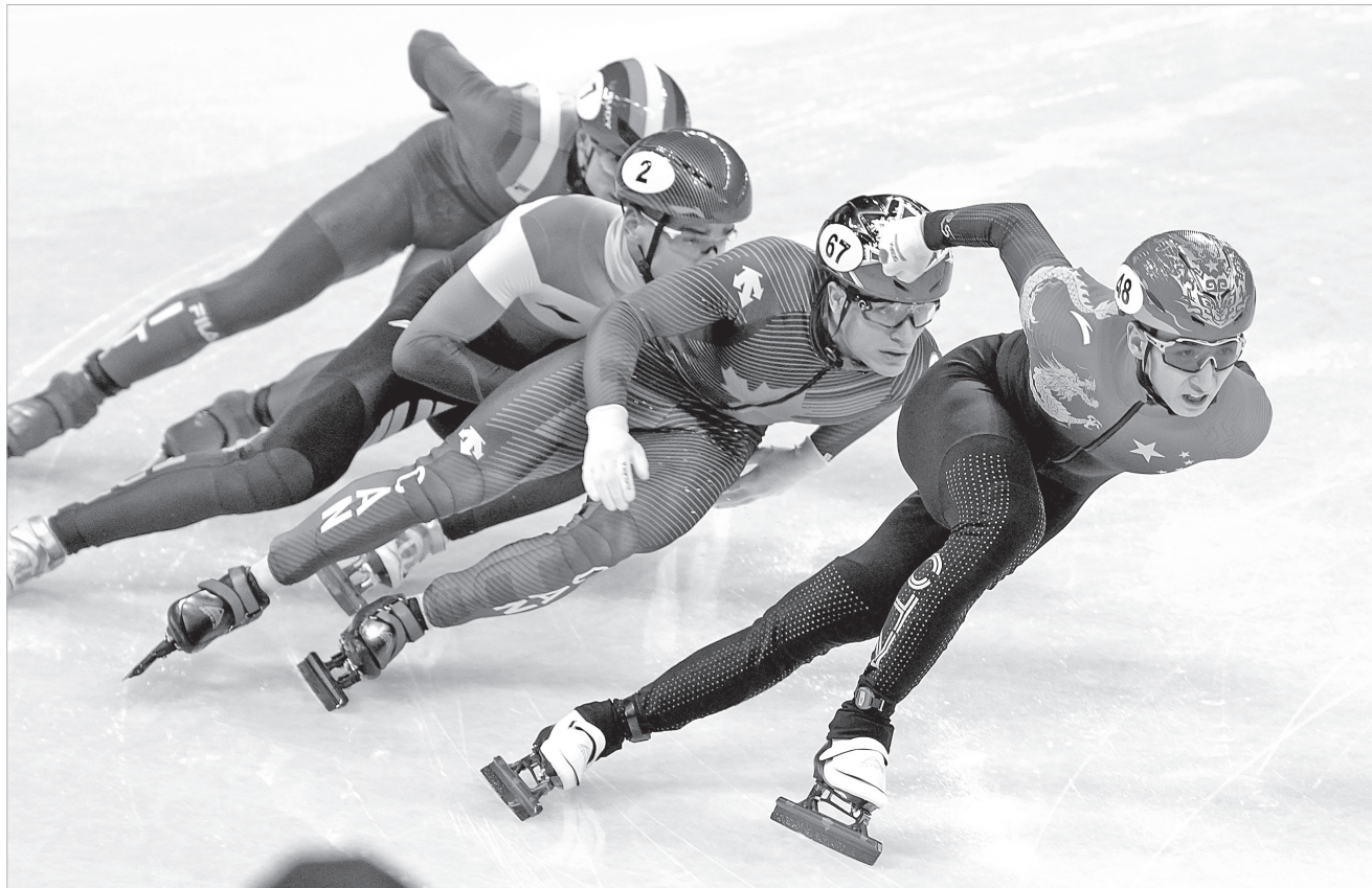
2月5日,中国队选手武大靖(右一)在比赛中。