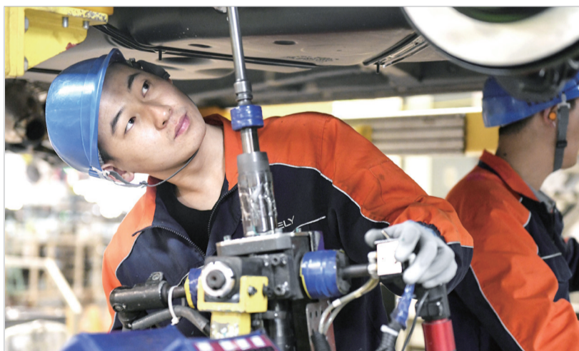
工人安装汽车底盘零件

钛宇航级宽幅钛板、宝鸡机床柔性车间等118个工业技改项目加快建设,中国钛谷钛及新材料产业园一期建成投用,世界领先的钛及钛合金军民融合产业园建成投产,国内轨道交通供电装备制造龙头企业——中铁高铁电气登陆科创板,正式挂牌交易。