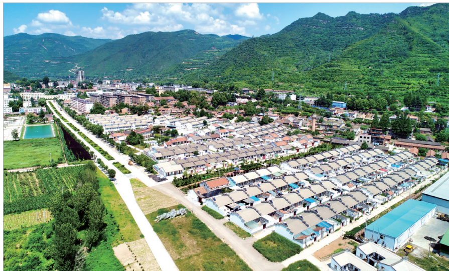
凤州镇龙口村村庄全貌