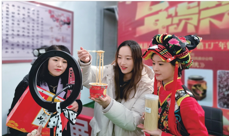
凤县组织主播在网上卖年货

1月初开始，市商务局联合市供销社、县区电商公共服务中心，组织市电商直播协会、市餐饮饭店行业协会、市擀面皮产业发展促进会及全市150多家企业、320多个网店、210多个直播间，在京东、淘宝、扶贫832平台、饿了么、抖音、快手等直播网销平台，集中开展“2022年宝鸡市产业直播年货大集”活动。截至1月24日，全市电商已发出快递72万余件，发货量逐日递增，19日最高达到41634单。其中，宝鸡擀面皮线上销售日均发货量65万份，臊子面、豆花泡馍、醋粉、米线等小吃日均发货5万份。陕西西凤酒电子商务公司相关负责人告诉记者，截至24日，西凤酒的省外网销已达2300多万元；秦圣擀面皮在抖音、快手等直播平台日均销售2000多单，日均销售额6万多元。