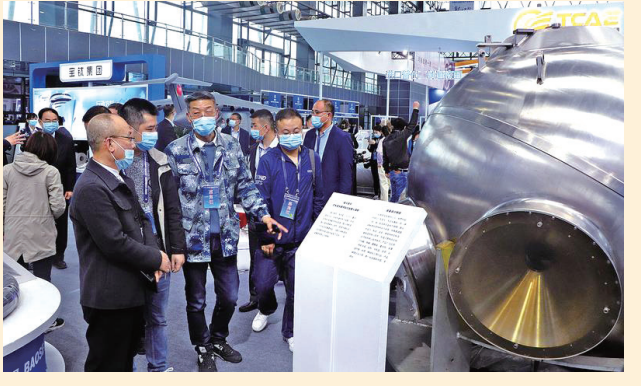
嘉宾在铁博会展馆参观