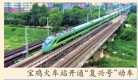
宝鸡火车站开通“复兴号”动车