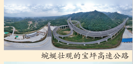
蜿蜒壮观的宝坪高速公路