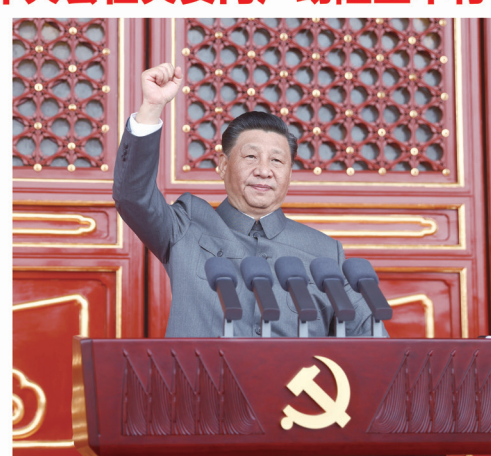
在庆祝中国共产党成立100周年大会上的讲话

习近平发表重要讲话强调，一百年前，中国共产党的先驱们创建了中国共产党，形成了坚持真理、坚守理想、践行初心、担当使命、不怕牺牲、英勇斗争、对党忠诚、不负人民的伟大建党精神，这是中国共产党的精神之源。一百年来，中国共产党团结带领中国人民，在长期奋斗中构建起中国共产党人的精神谱系，锤炼出鲜明的政治品格，历史川流不息，精神代代相传，我们要继续弘扬光荣传统、赓续红色血脉，永远把伟大建党精神继承下去、发扬光大！