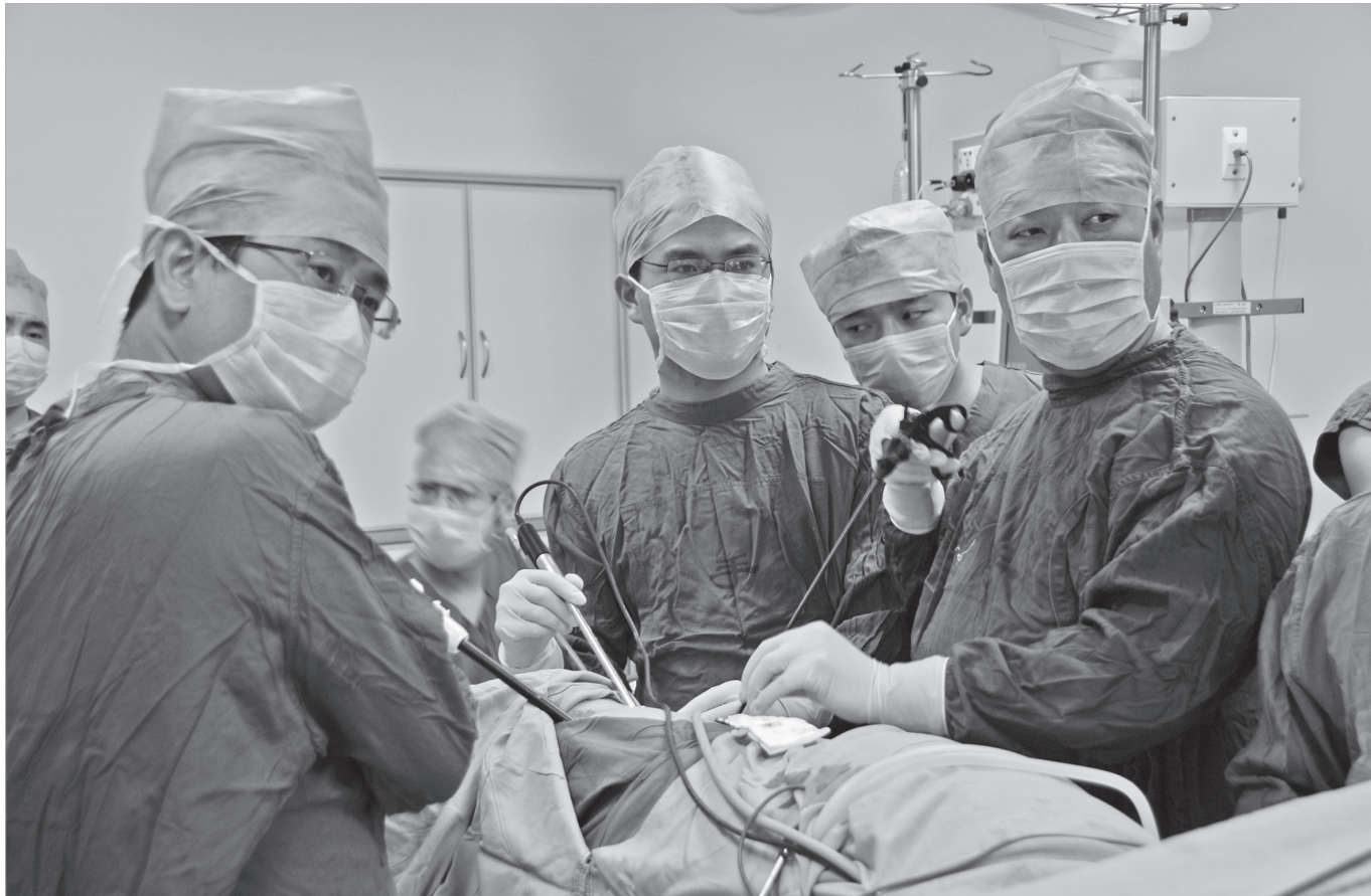
胸外科团队协作为患者做手术

为了汲取更多的医学知识，胸外科的医护分批次前往省内外知名医院深造学习，已有10人拿到中华医学会重症医学专科培训合格证，20人拿到胸腔镜技术各级培训证书。此外，还创建了宝鸡市