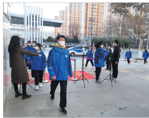
师生进校门时进行测温、扫码

本报讯 学校是一个比较特殊的场所，每天进出校园的人员、车辆比较多。12月22日下午4时，记者随教育部门工作人员一起来到位于市区姜谭路的宝鸡市姜谭高级中学，看看师生们是怎样落实疫情防控各项工作的。