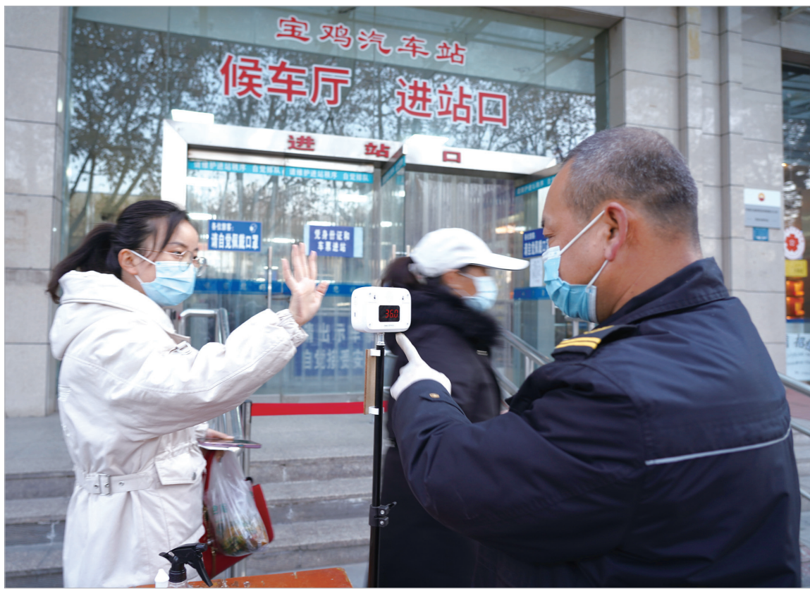
工作人员给旅客测温

本报讯 “各位旅客，请佩戴好口罩，保持1米安全距离，主动测温，出示健康码，有序排队进站……”12月22日下午，记者在位于市区经二路西段的宝鸡汽车站进站口看到，工作人员严格落实各项疫情防控措施，确保群众安全便捷出行。