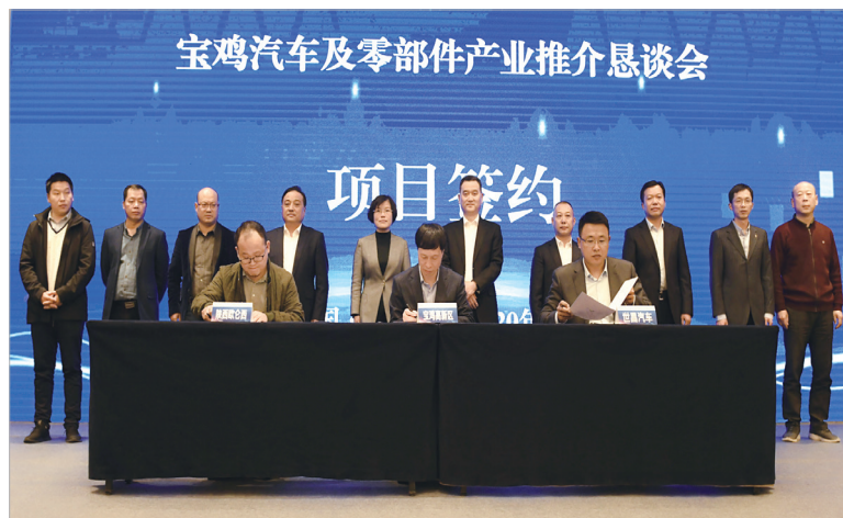
汽车及零部件产业链招商签约仪式