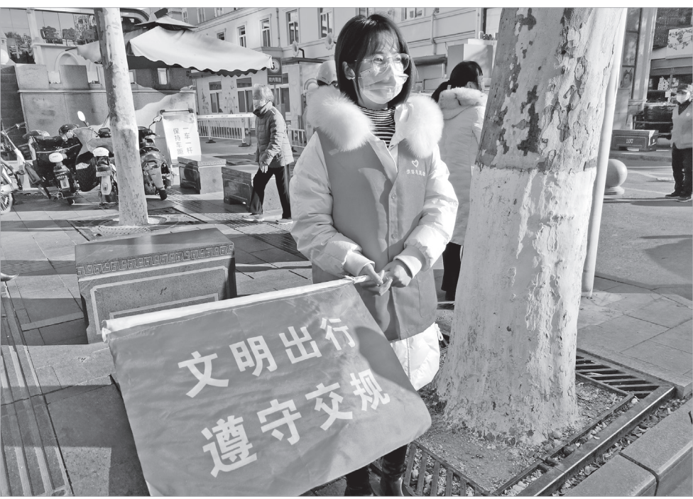
志愿者在街头执勤