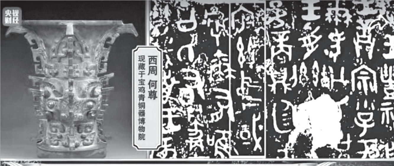
节目问答环节中何尊铭文展示（视频截图）

山川、流水、麦田、悠悠读诗声……这期节目沉静地展现了周原诗经文化的深厚、悠长、美好，并用现代人的视角去品读佳作，让人倍感亲近。