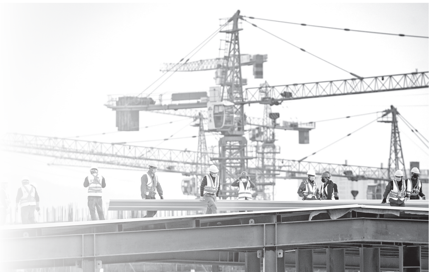
中建三局的建设工人在武汉雷神山医院建设工地施工(2020年2月4日摄)。

精神照亮前路，梦想铸就辉煌。与时俱进的企业家精神正激励广大企业家攻坚克难、勇攀高峰，奋力谱写新时代发展新篇章。