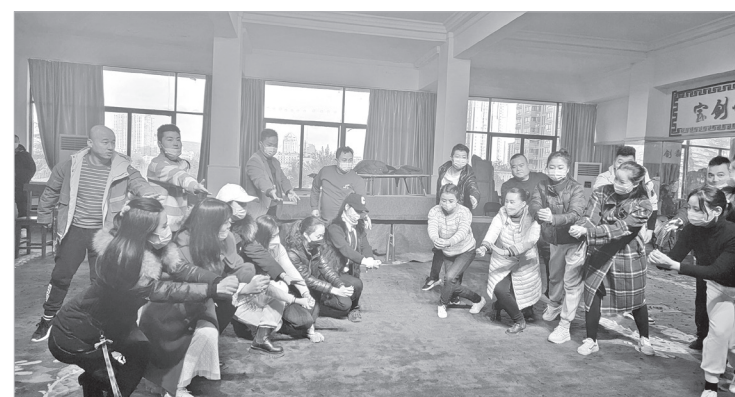
秦腔现代戏《焦裕禄》正在排练中