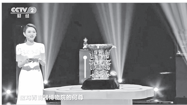
宝鸡青铜器博物院的何尊