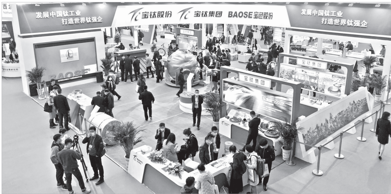
钛博会上客商云集

“图解《陕西省提升全省重点产业链发展水平若干政策措施》,省商务厅驻德国代表处对接中德钛合金义齿合作生产项目……”近日,宝鸡高新区投资合作局负责人一边翻看“宝鸡高新区钛产业链服务交流微信群”里的信息,一边向记者介绍,今年以来,宝鸡高新区招商部门积极履行区级钛及钛合金产业链“链主”单位工作职责,认真挖掘钛业“富矿”,形成了强大工作合力。