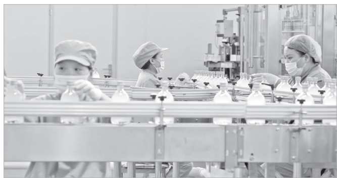
陕西无时闲酒业低度发酵酒生产线

助,带着我们办理各种手续,产品生产出来后,他们还帮我们开拓市场。”谈起扶风招商部门,企业负责人感慨地说,好的营商环境让他们决定继续投资10亿元,建设精酿啤