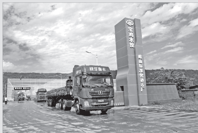
岐山标准化砂石厂

该项目于2018年9月正式启动,全市计划建设国有砂石厂11座,年产能将达到570万立方米,实现产值3亿元,上缴利税将达到3000万元。目前,扶风县、岐山县、陈仓区、宝鸡高新区、凤县、太白县6座国有砂石厂生产线建成运营,实现了同行业“低耗能、高产量、精产品”的生产工艺。剩余5座砂石厂正在加快建设,力争今年内建成3座,明年上半年建成2座。今年1-9月份,6座建成的砂石厂生产砂石103万方,销售收入1.25亿元。