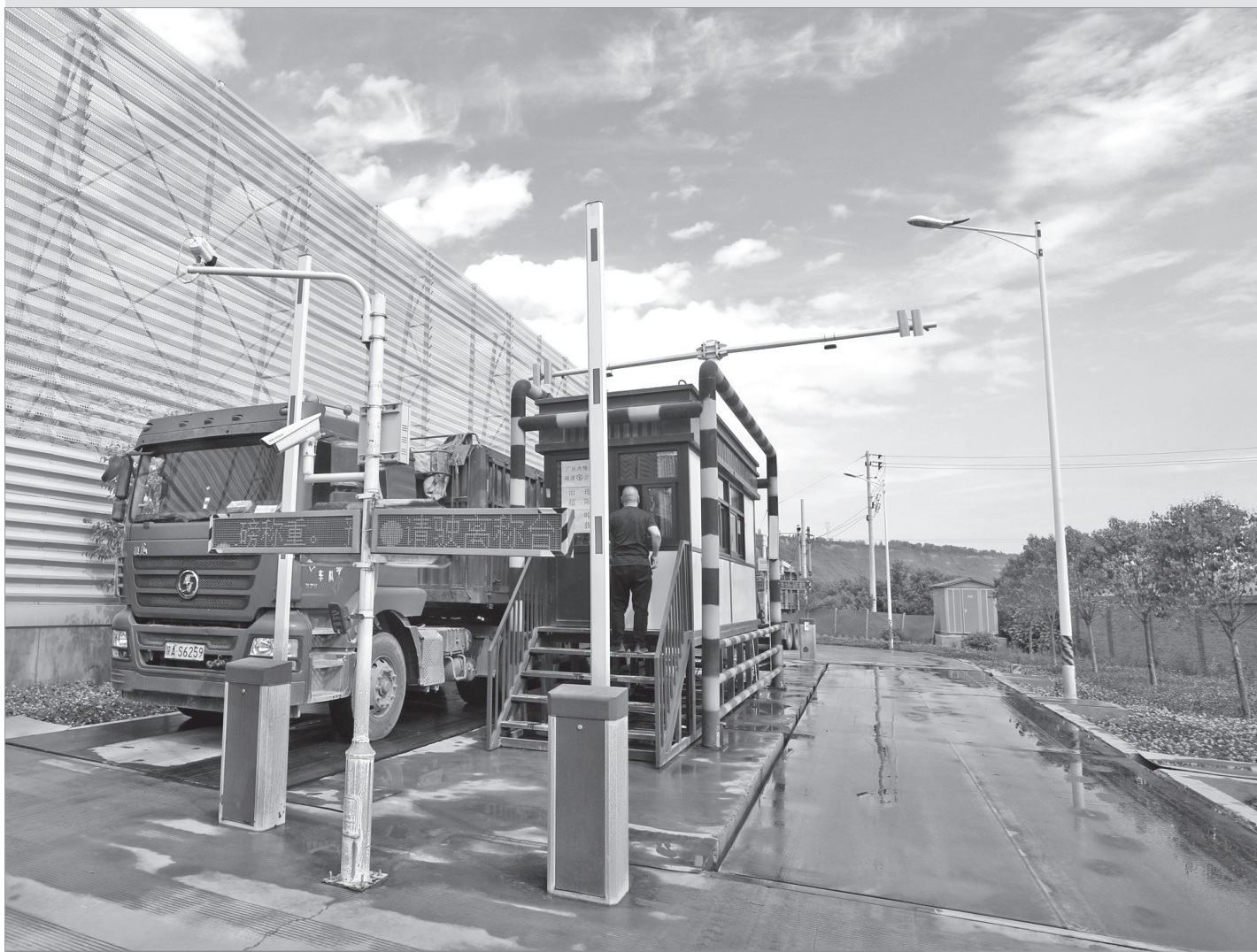
宝鸡市国有标准化砂石厂项目