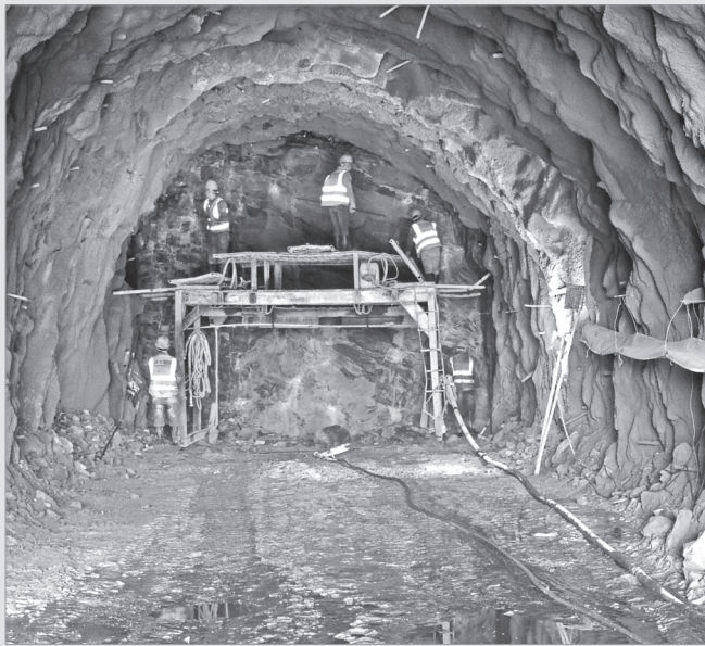
太白县龙王河溢洪洞洞室钻孔施工现场

工程建成后,可解决塘口、蒿谷堆等5个村1万余人的用水难题,有效改善绿农、秦西等6个农业园区和5个村农田灌溉面积0.43万余亩。