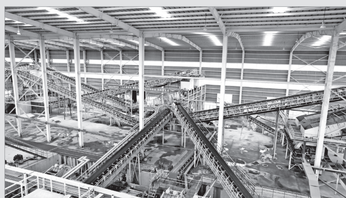
扶风标准化砂石厂