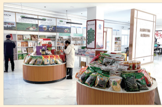
电子商务公共服务中心