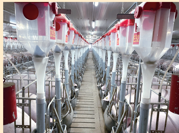
先进的能繁母猪猪舍

该项目可存栏能繁母猪6000头,年出栏商品仔猪15万头,是宝鸡地区规模最大、设施最先进的母猪繁育基地。