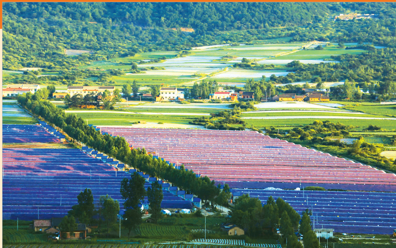
秦西设施农业全景图