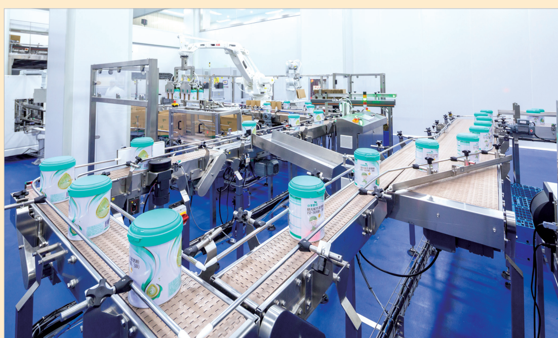
小羊妙可羊奶粉罐装生产线

“抓项目就是抓发展,抓项目就是赢未来。”市农业农村局把项目建设摆在更加突出的位置,下好投资招引“先手棋”,打好项目建设“硬仗”,助力乡村振兴加快步伐,开花结果。