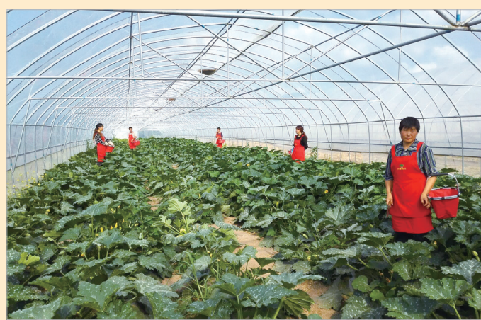
工人在蔬菜大棚劳动

秦西绿色蔬菜产业园地处秦岭腹地太白县,海拔1680米。园区坚持走标准化生产、产业化经营、品牌化发展的路子,在太白山区率先实施“无化无农残”种植,推广生态循环农业综合利用新技术。园区先后顺利通过了国家绿色食品认证、GAP认证和国家产品地理标志认证;每年向社会提供各类绿色蔬菜和食用菌800吨,产值达600万元以上。