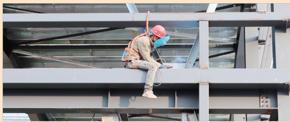
农特产品外贸物流产业园正在装修

目前盛源果品项目已进入冷库安装阶段,陕果冷库联建项目主体钢结构安装已完成。建成后每年可加工贮存销售鲜果6万吨,总产值6.5亿元;年出口苹果3万吨,销售额可达3亿元。