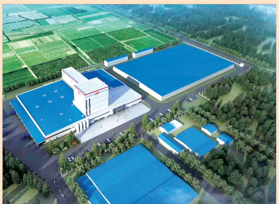
和氏特殊医学配方奶粉生产线项目整体规划效果图