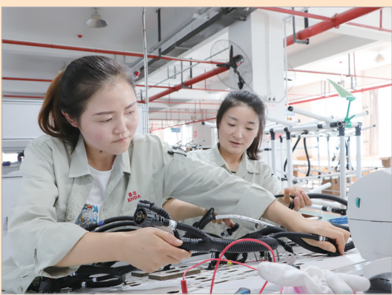
工人在生产线上紧张工作