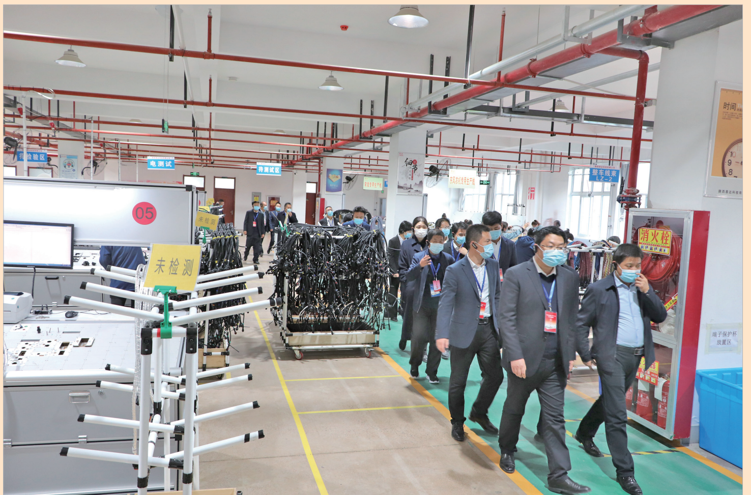
与会人员参观恩达汽车线束生产车间

项目全面达产后,可年产500万套电控线束,实现产值5亿元,上缴税金5000万元,将成为国内第二大汽车线束生产基地,带动周边500人就业。