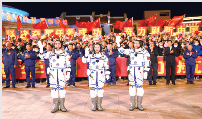
10月15日晚，神舟十三号载人飞行任务航天员乘组出征仪式，在酒泉卫星发射中心问天阁广场举行。翟志刚（右）、王亚平（中）和叶光富即将开启为期6个月的飞行任务。

目前，天和核心舱和天舟二号、天舟三号组合体已进入对接轨道，状态良好，满足与神舟十三号交会对接的任务要求和航天员进驻条件。