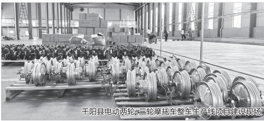
千阳县电动两轮、三轮摩托车整车生产线项目建设现场

本报讯 近日,记者在千阳县电动两轮、三轮摩托车整车生产线项目建设现场看到,工作人员正在忙碌。前不久,千阳县在常态化疫情防控形势下,通过线上签约的方式集中签约6个招商引资项目,帮助项目尽快落地,跑出发展“加速度”。