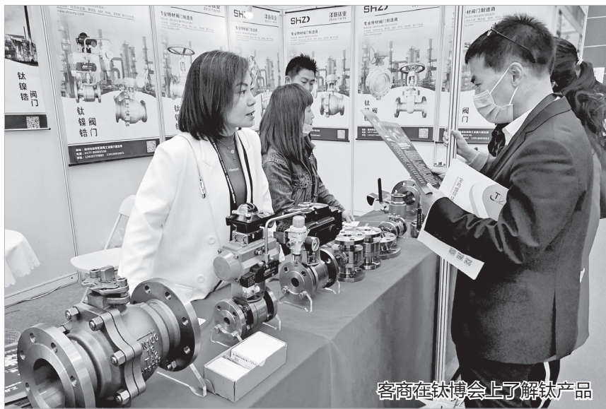
客商在钛博会上了解钛产品

置基础上,补链强链,提升供给链、价值链,形成一个金字塔往上的子系统、分系统、总装单位的高端钛产业聚集区。今年全市谋划储备钛产业项目60余个,全方位开展产业链招商,同时加快实施新材料产业园、钛及钛合金航空新材料产业园等一批重大园区项目。