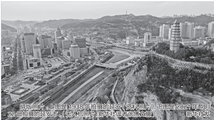
拼版照片：上图是1938年拍摄的延安（资料照片），下图是2021年4月22日拍摄的延安市。（无人机照片）