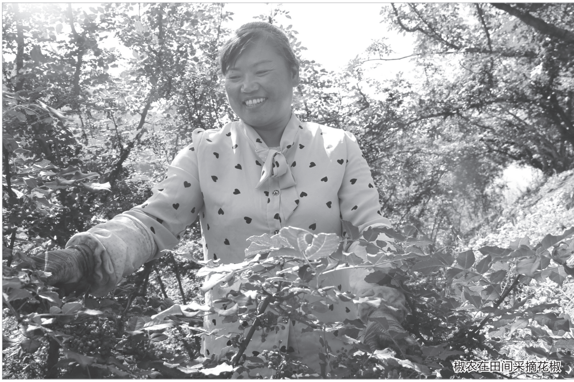
椒农在田间采摘花椒