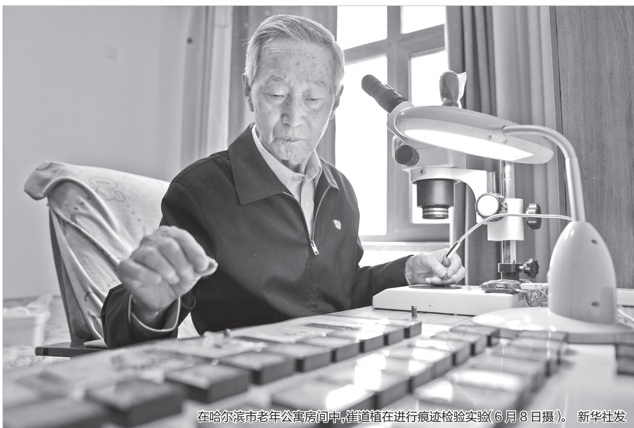
在哈尔滨市老年公寓房间中，崔道植在进行痕迹检验实验(6月8日摄)。

他是一个传奇，屡破惊天大案，检验痕迹物证7000余件，无一差错；他是一个标杆，把对党的忠诚，浸润到每一一起案件的侦破，从不计名利得失。他是“七一勋章”获得者崔道植。从旧中国衣食无着的农家子弟成长为新中国首席痕迹检验专家，87岁高龄的崔道植对党和人民深怀感恩之心：“只要我的眼能看、腿能动，我就要为党的刑侦事业工作到最后一刻！”