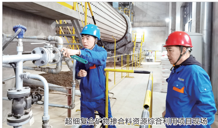
超细复合矿物掺合料资源综合利用项目现场