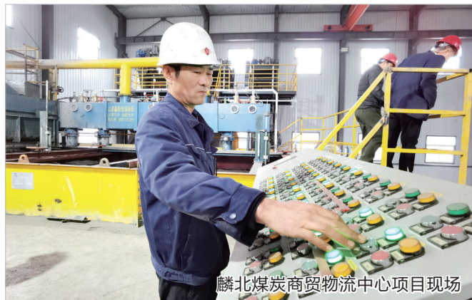
麟北煤炭商贸物流中心项目现场