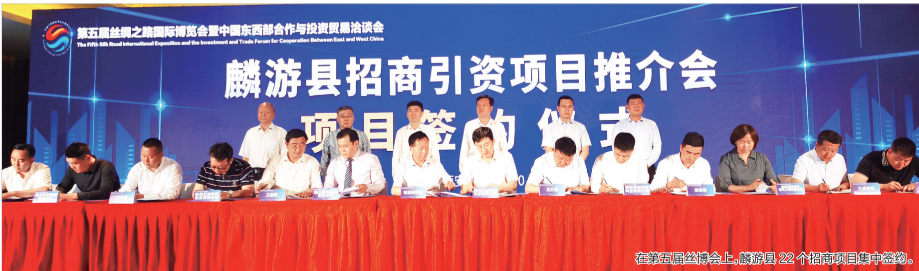
在第五届丝博会上,麟游县22个招商项目集中签约。