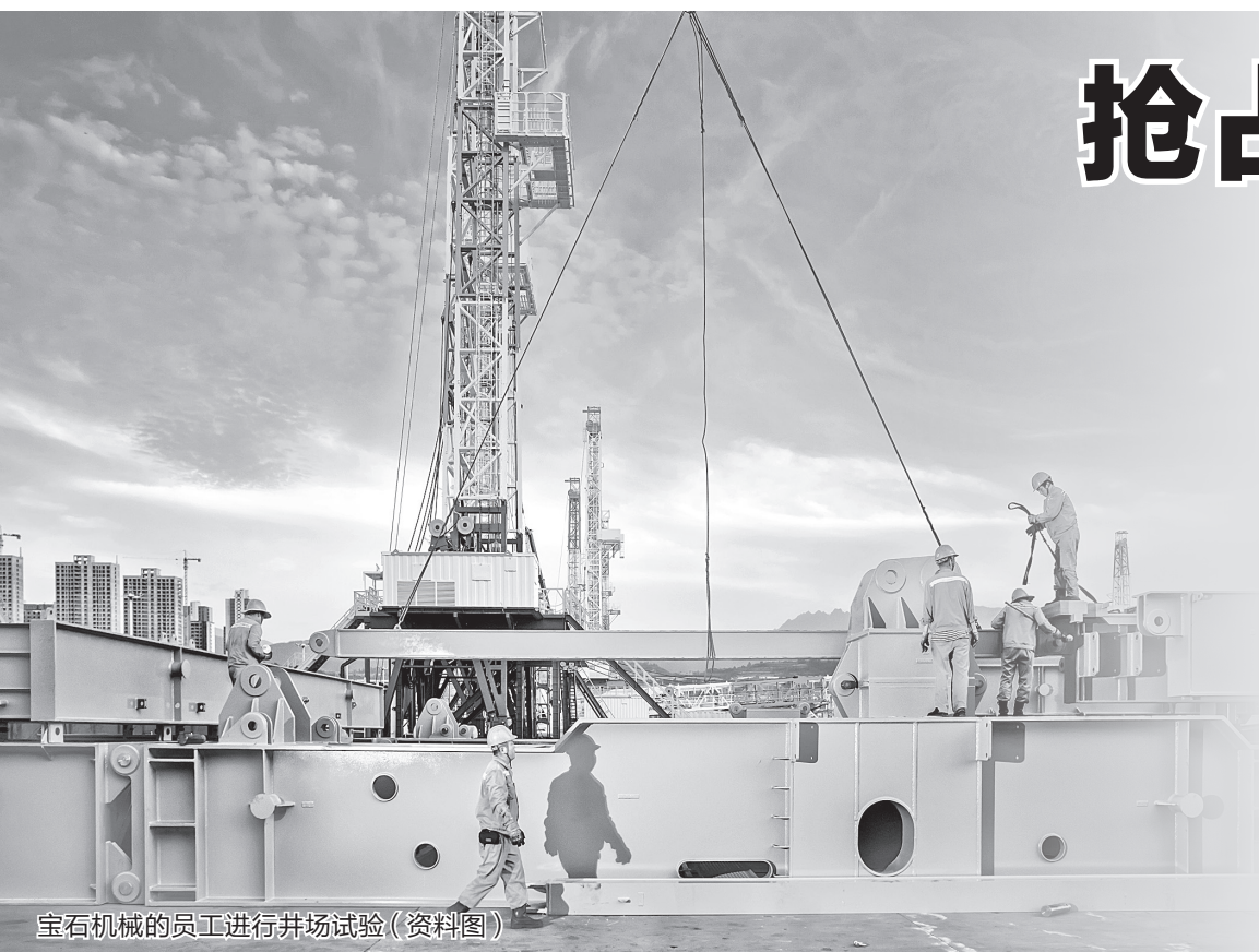
宝石机械的员工进行井场试验(资料图)