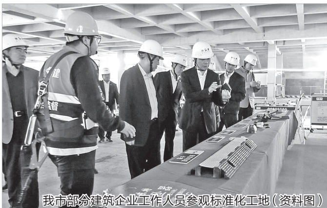
我市部分建筑企业工作人员参观标准化工地(资料图)

为破解农产品生产标准化程度不够高、监管力度欠缺和人员经费保障不足的问题,今年,我市将着力构建与质量