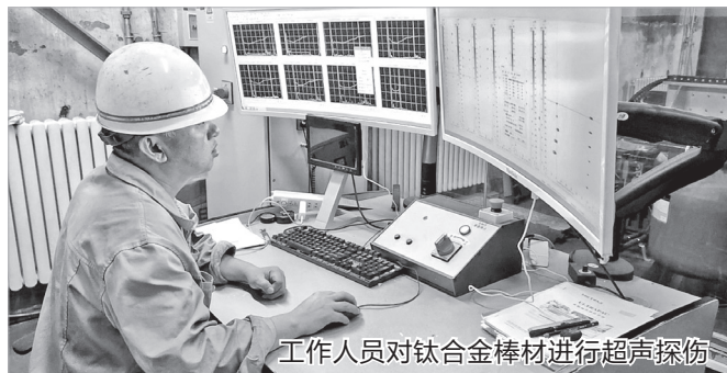
工作人员对钛合金棒材进行超声探伤