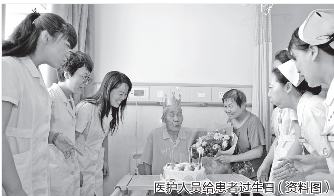
医护人员给患者过生日(资料图)

兴农、绿色兴农相适应的标准体系。加快奶山羊、矮砧苹果、猕猴桃等特色产业标准制修订,组织种子、农技、农机等专家建立攻关团队,集成推广一批绿色标准生产模式,依托优质小麦产业开发联盟,推广“龙头企业+农技部门+新型主体