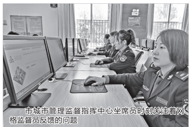
市城市管理监督指挥中心坐席员时刻关注着网格监督员反馈的问题

理的“大脑”,连接“大脑”与城市的“末梢神经”的是“城管通”平台,市区大街小巷的各种市容市貌以及环境问题,会第一时间传递到这里,并得到及时处理。