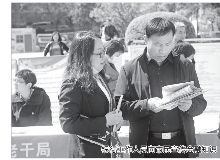
银行工作人员向市民宣传金融知识

为落实“全民国家安全教育日”宣传主题,该行还积极组织人员参与“国家安全法知识答题活动”,并多次观看警示教育视频。如今,走进邮储银行宝鸡市分行各个营业网点,都能看到LED屏上滚动播放着法治宣传标语,电视屏幕上循环播放着法律