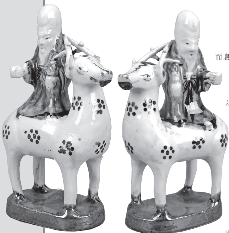
清褐彩寿星骑鹿瓷塑烛台

日出而作,日落而息,火堆和火把是人类最初使用的照明工具,可古人从没停止对光明的追求,从最原始的篝火瓦豆到后来的烛灯引盏,唯有灯在黑暗中赋予人光明。烛台作为照明器具之一,指带有尖钉或空穴以托住蜡烛的无饰或带饰的器具。